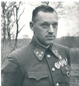
Генерал-лейтенант К.К. Рокоссовский в октябре – декабре 1941 года командовал 16-й армией Западного фронта. В составе этой армии сражалась сибирская дивизия А.П. Белобородова

терному выражению Гитлера, «можно штурмовать небеса». (Именно 6-я армия положила к ногам Гитлера Париж, Харьков и обещала ему взять Сталинград. Но помешали сибиряки.) Затем пришлось вникнуть в историю уникального сообщества СС и изучать всё – от порядка отбора и воспитания членов СС и их жён до отчётов организованной Гиммлером секретной экспедиции в Тибет. И теперь я наконец могу рассказать своим читателям о том, какого грозного противника одолели наши отцы и деды.