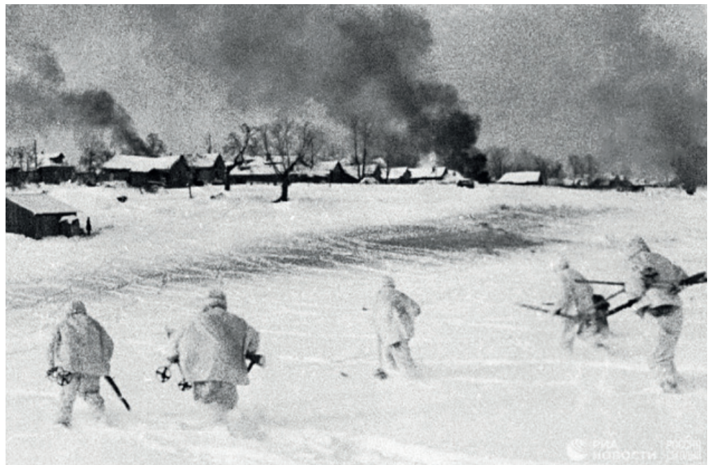
Бой за подмосковную деревню на Волоколамском шоссе

...В штабе 16-й армии Западного фронта комдива Белобородова прозвали «генерал Бегом». Своим полковникам он внушал: «Единственный наш шанс – это воевать бегом». Полковники у Афанасия Павлантьевича были всех мер. И комбаты не хуже. Долгими зимними ночами они с бойцами «бегали» в глубокие рейды по немецким тылам.