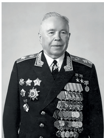
Командующий Московским военным округом генерал армии А.П. Белобородов

– Неужели и сейчас заметно? – весело удивляется Белобородов, в глазах – озорство.