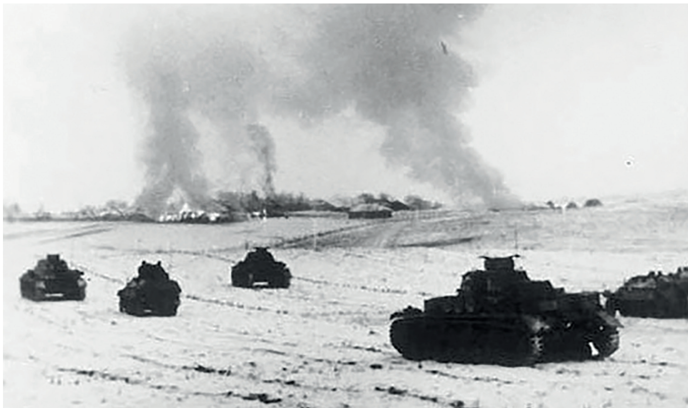
Немецкие танки атакуют советские позиции в районе Истры. 25 ноября 1941 года