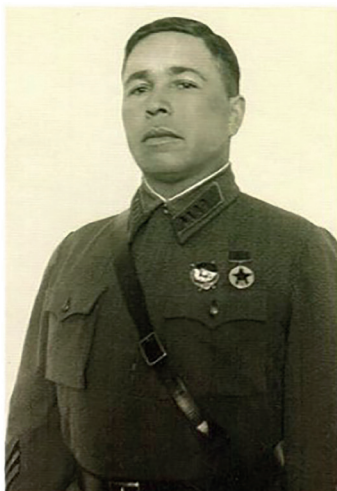
А.П. Белобородов. Две звезды в петлице указывают на его звание – генерал-майор

траншею. А как они на бросок гранаты подберутся, мы выскакиваем им встречу и врукопашку. Здоровенные они, эсэсы, ну да и мы не из больницы. Справлялись.