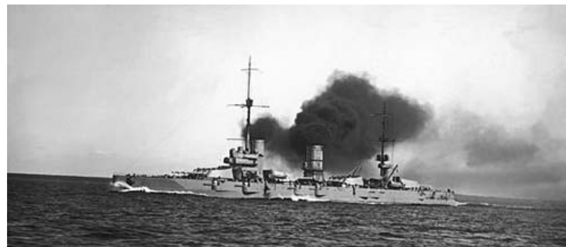
Линкор-дредноут «Гангут» постройки 1914 года. В 1925 году переименован в «Октябрьскую революцию». 30 августа 1941 года, как и все корабли Кронштадта, был включён в систему артиллерийской обороны Ленинграда. Нёс на борту могучую артиллерию: в его четырёх башнях размещались 12 орудий калибра 305 мм. Залп главного калибра «Гангута» весил более пяти с половиной тонн (вес одного снаряда составлял от 390 до 471 килограмма в зависимости от типа боеприпаса). Кроме того, линкор был вооружён шестнадцатью 120 мм орудиями и десятками других стволов вспомогательных калибров. Как плавучая батарея, линкор создавал серьёзные проблемы противнику, иногда до двенадцати раз в сутки, поэтому регулярно подвергался налётам немецких бомбардировщиков, но отбивался, (уничтожив зенитным огнём пикировщиков Ю-88), и, несмотря на повреждения, оставался в строю. За оборону Ленинграда линкор был награждён орденом Боевого Красного Знамени. Свою службу на флоте линкор завершил в 1956 году.