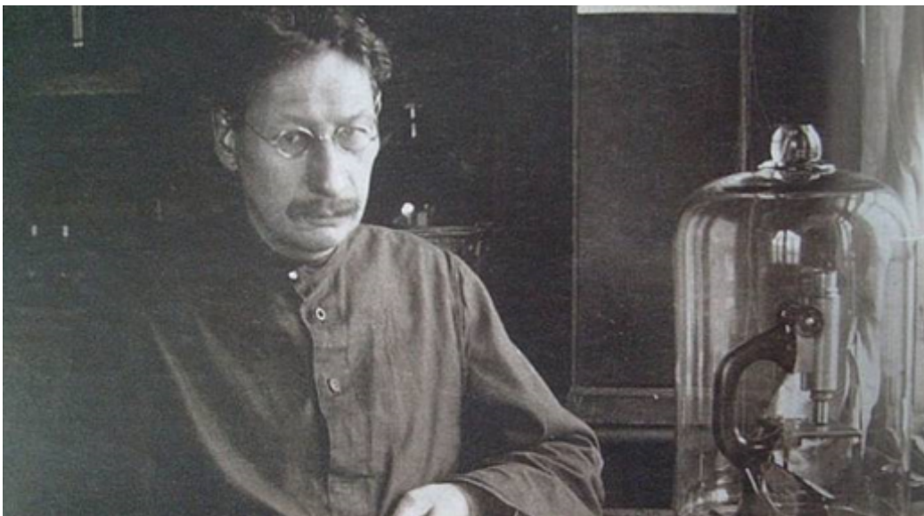
Павел Александрович Флоренский (1882-1937) – священник Русской православной церкви, богослов, религиозный философ, поэт. В 1933 году осуждён на 10 лет заключения. 25 ноября 1937 года особой тройкой НКВД Ленинградской области он был приговорён к высшей мере наказания и расстрелян.

Такая же «тройка» приговорила к смерти выдающегося философа, богослова, универсального учёного (одного из разработчиков плана электрификации России) отца Павла Флоренского.