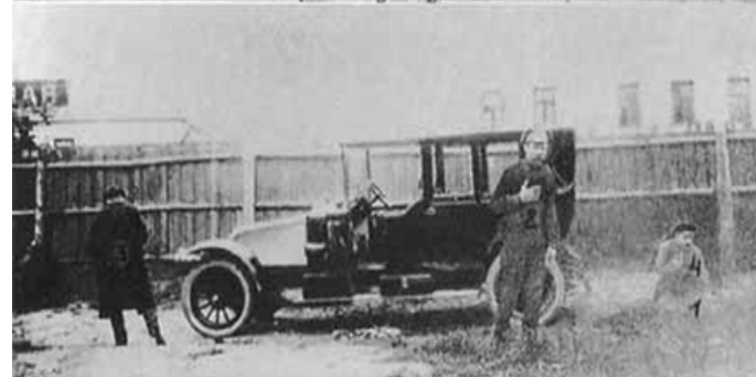
Фото N 3. Ленин падает, кастелянша пытается бежать, Каплан направляется к воротам. Инсценировку нельзя считать следственным экспериментом: в нём должны были участвовать реальная подозреваемая (её убьют и сожгут в Кремле на следующий день), реальная свидетельница (кастелянша Попова после случайного ранения могла передвигаться) и сам Ленин как потерпевший.