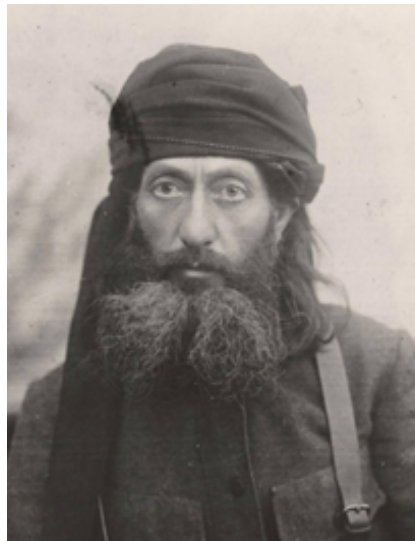
Нестор Александрович Каландаришвили (1876–1922) – революционный деятель, анархист, один из руководителей партизанского движения в Восточной Сибири во время гражданской войны.

Оказавшись в ссылке в Иркутске, Каландаришвили, судя по архивам полицейского управления, возглавил кавказскую этническую группировку и готовил масштабную аферу с чеканкой фальшивых монет из награбленного серебра. Примыкал к анархистам, затем к анархистам-коммунистам. Разумеется, политический окрас подобных фигур – вещь условная.