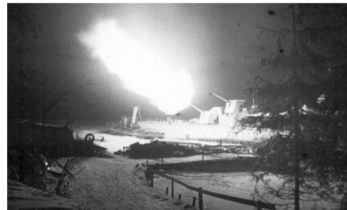
Эскадренный миноносец Краснознаменного Балтийского флота «Стойкий» ведёт обстрел гитлеровских позиций. Ленинград. 1943 г.

Начиная с 1941 года, спасённый им флот – от линкоров до тральщиков – неопределимо помог Ленинграду отбиться от немецко-финской осады. Почти все боевые корабли служили плавучими батареями. Башни главного калибра (305 мм) линкора «Гангут», переименованного в «Октябрьскую революцию», подавляли в артиллерийских дуэлях дальнобойные орудия врага, громили скопления танков и мотопехоты, в ключья рвали шрапнелью его аэростаты-корректировщики. Крейсера и эсминцы, встав на якоря в Неве, Ладоге и Финском заливе, били по вражеским укреплениям и живой силе, уничтожали переправы и десантные баржи.