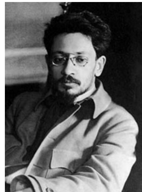
Яков Михайлович Свердлов (1885-1919). Председатель ВЦИК (формальный глава РСФСР) в ноябре 1917 — марте 1919 гг. Свердлов открыто выступал за революционный террор, инициировал красный террор, удар по деревне и расказачивание (по сути, геноцид военного сословия России – казаков). Был одним из организаторов разгона Учредительного собрания. Один из руководителей большевистского правительства наряду с В. И. Лениным, давших санкцию на расстрел последнего российского императора Николая II и его семьи.

А Ленин явно не собирался ни умирать, ни отдавать власть. Наверное, ярость на вероломного Свердлова только добавила Ильичу сил.