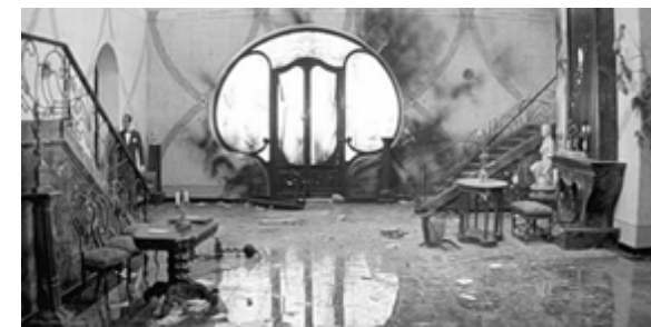
Помещение, где было совершено убийство.

Блюмкин после теракта направился в отряд (полк) ВЧК, расквартированный в Трёхсвятительском переулке. Командовал отрядом эсер Протопопов. Вдохновлённые успехом акции Блюмкина, бойцы отряда и поддерживавшие мятеж рабочие-дружинники (члены партии социал-революционеров) захватили Центральный телеграф и здание ВЧК.