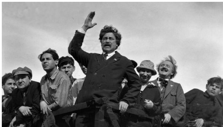
Емельян Михайлович Ярославский (урождённый Миней Израилевич Губельман) – революционер, советский партийный деятель, идеолог и руководитель антирелигиозной политики в СССР. Главный инициатор кампании против рождественских ёлок и отмены рождественского выходного, гонений на новогодние ёлки в СССР в 1929—1935 годах. Ярославский выступал и за запрет на исполнение церковной музыки, в том числе П. Чайковского, С. Рахманинова, Моцарта, Баха, Генделя, других композиторов.

Член Сиббюро РКП (б) Борис Шумяцкий в своей телеграмме в ЦК от 23 декабря 1921 года прямо настаивал на прекращении политики военного коммунизма. Из потока правительственных депеш в Москву рекомендации Шумяцкого выделяются своим радикализмом.