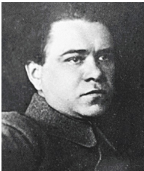
Яков Петерс (1886-1938). После июльского левозсеровского 1918 года мятежа сменил Дзержинского на посту председателя ВЧК. Во время большого террора репрессирован и расстрелян на полигоне Коммунарка.

На Лубянке задержанную допрашивает исполняющий обязанности главы ВЧК Яков Петерс и его следователи.