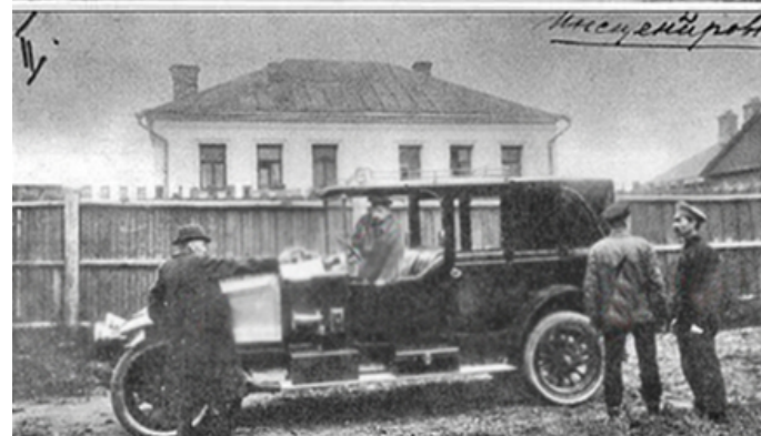
Фото N 2. Каплан стреляет.