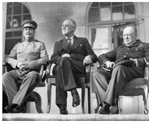
Лидеры «большой тройки» – И. В. Сталин (СССР), Ф. Д. Рузвельт (США), У. Черчилль (Великобритания) на конференции в Тегеране 28 ноября – 1 декабря 1943 года.

Это уже была другая армия, отряхнувшая с себя робость и пугливую оглядку, навязанные сталинскими репрессиями. Сталинград и Курск показали, что наши военные быстро обучились современной войне, обрели драгоценную уверенность в своих силах и победный кураж.