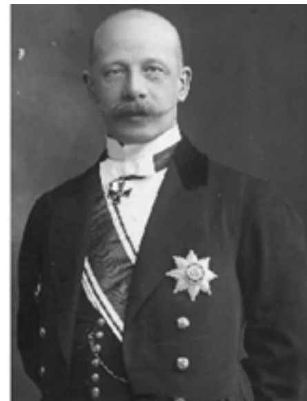
Граф Вильгельм фон Мирбах был первым иностранным послом, аккредитованным при советском правительстве