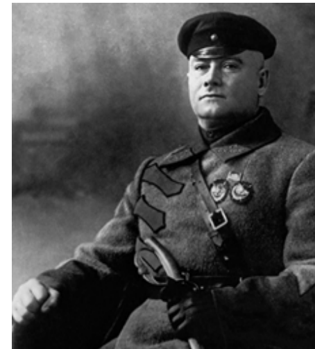
Григорий Иванович Котовский (1881–1925) – революционер, советский военный и политический деятель, участник Гражданской войны. Член Реввоенсовета СССР.

Григорий Котовский – удалой налётчик, друг Мишки Япончика 1 , бомбил помещичьи усадьбы в Бессарабии и даже грабил банки. Сидел в тюрьме под смертным приговором за убийство, но был освобождён Февральской революцией. Служил большевикам в качестве комбрига и комдива РККА. Особо отличился при подавлении антисоветского восстания крестьян на Тамбовщине. Застрелен в 1925 году на своей даче старым знакомцем по уголовному прошлому. Убийца Котовского был осуждён на 10 лет, но вскоре выпущен на волю «за примерное поведение». Однако тут же был убит якобы возмущёнными сподвижниками «легендарного комдива». Как и в случае с Каландаришвили, живых свидетелей не осталось.