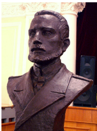
Бюст Алексея Щастного. Кронштадт

А капитан первого ранга Щастный и после своей гибели продолжал защищать Родину.