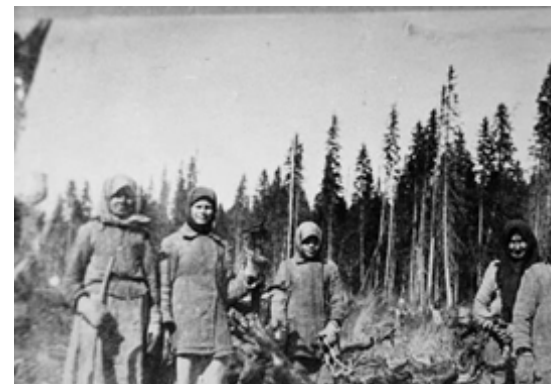
Спецпереселенцы на работе.

Несчастные спецпереселенцы не стреляли из обрезов в председателей колхозов (за вооружённое сопротивление в СССР судили по статье «бандитизм»), а вполне лояльно вели себя по отношению к государству. Однако после кончины отца народов их не сочли нужными реабилитировать. Хотя никакой вины перед государством на них не было.