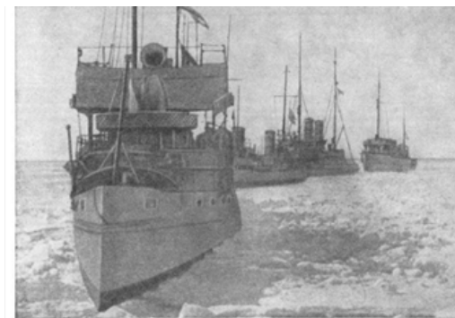
19 февраля 1918 года началась операция по спасению кораблей Балтийского флота от захвата германскими и финскими войсками и переводу их из Ревеля и Гельсингфорса в Кронштадт. Она вошла в историю России как Ледовый поход Балтийского флота.

В результате там собралось 236 боевых и вспомогательных судов. В том числе 6 линкоров, 5 крейсеров, 54 эсминца, 12 подводных лодок, а также тральщики, минные заградители, транспорты и пр.