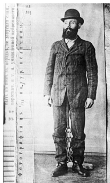
Симон Аршакович Тер-Петросян – российский профессиональный революционер, организатор подпольных типографий, транспорта оружия и литературы, денежных экспроприаций. Тюремный фотоснимок.

Непревзойдённым абсолютom среди боевиков русской революции был и остаётся потомок захудавшего рода армянских князей Симон Тер-Петросян. Ещё до событий 1905 года юный Камо (детская кличка, ставшая партийным псевдонимом) стал известен на Кавказе успешными экзами и терактами. Дерзкий, хитрый, жестокий убийца – как и надлежит террористу. Число арестов у Камо равнялось числу побегов.