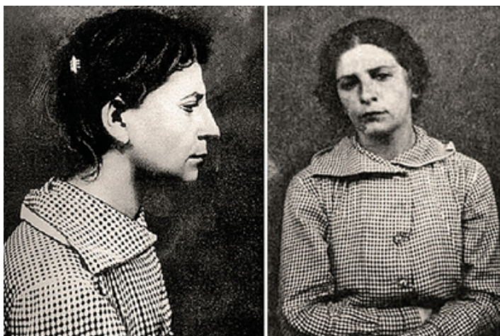
Фанни Каплан на Лубянке. Снимки сделаны в ночь на 31 августа 1918-го. На этом последнем фото Фанни только 28 лет. Болезни и каторга сильно состарили её.

Но на третий день к Петерсу явился посланец Свердлова с приказом перевести Ф. Каплан из ВЧК в Кремль. После ранения Ленина функции главы государства перешли к Свердлову. И Петерс вынужден был ему подчиниться.