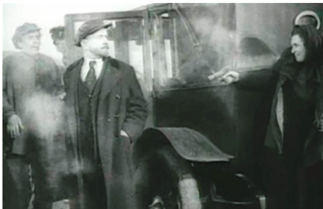
Покушение на Ленина. Кадр из фильма М. Ромма «Ленин в 1918 году».

В истории политических убийств трудно найти более неподходящего киллера, чем якобы стрелявшая в Ленина 30 августа 1918 года Фанни Каплан. Разве что забубённый неудачник Ли Харви Освальд, назначенный ФБР убийцей президента США Джона Кеннеди, и так же, как Фанни Каплан, срочно застреленный после ареста, чтобы не выболтал лишнего.